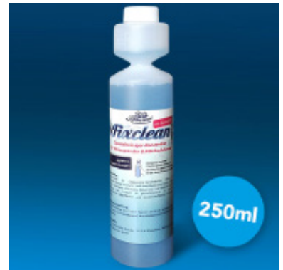
Milchschaumreiniger von Café Bonitas

Wir empfehlen die sofortige Reinigung nach jeder Benutzung.